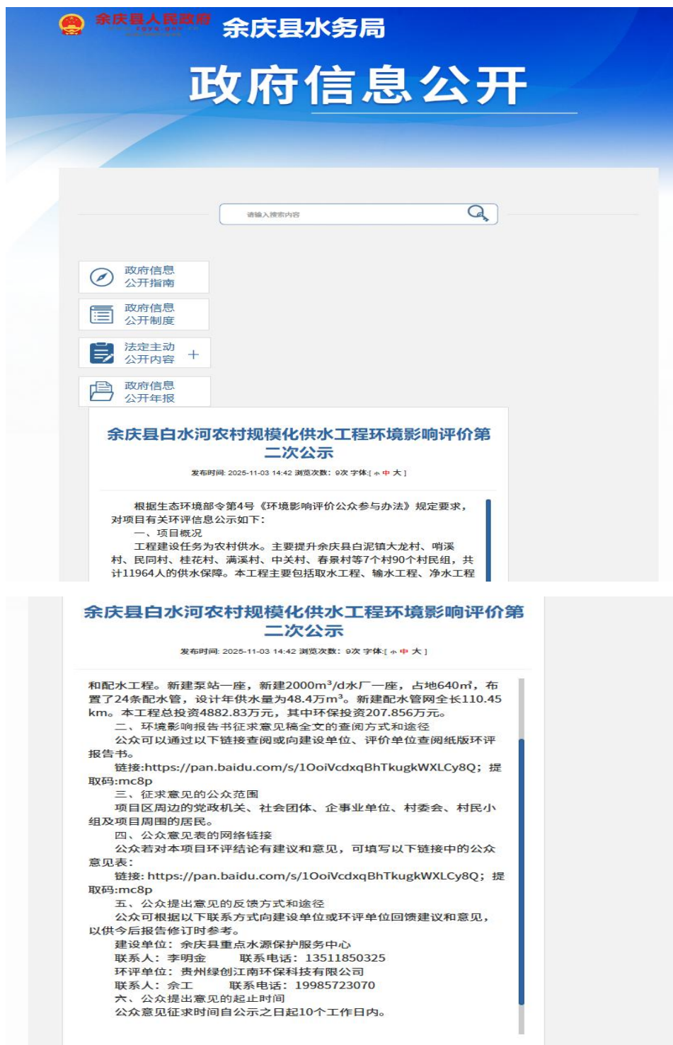
图 2 第二次公示截图