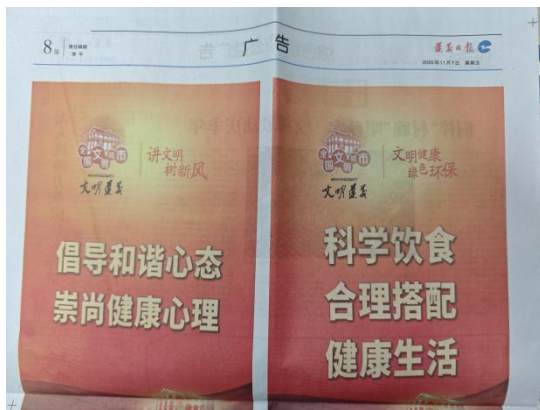
图 6 第二次报纸公示截图