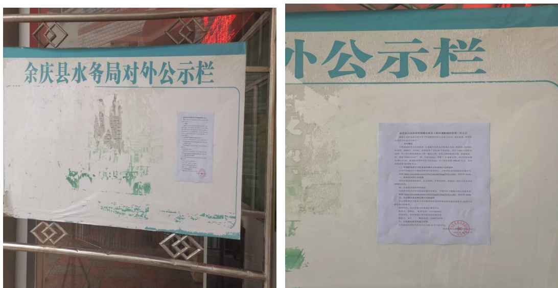
图 4 张贴公示照片