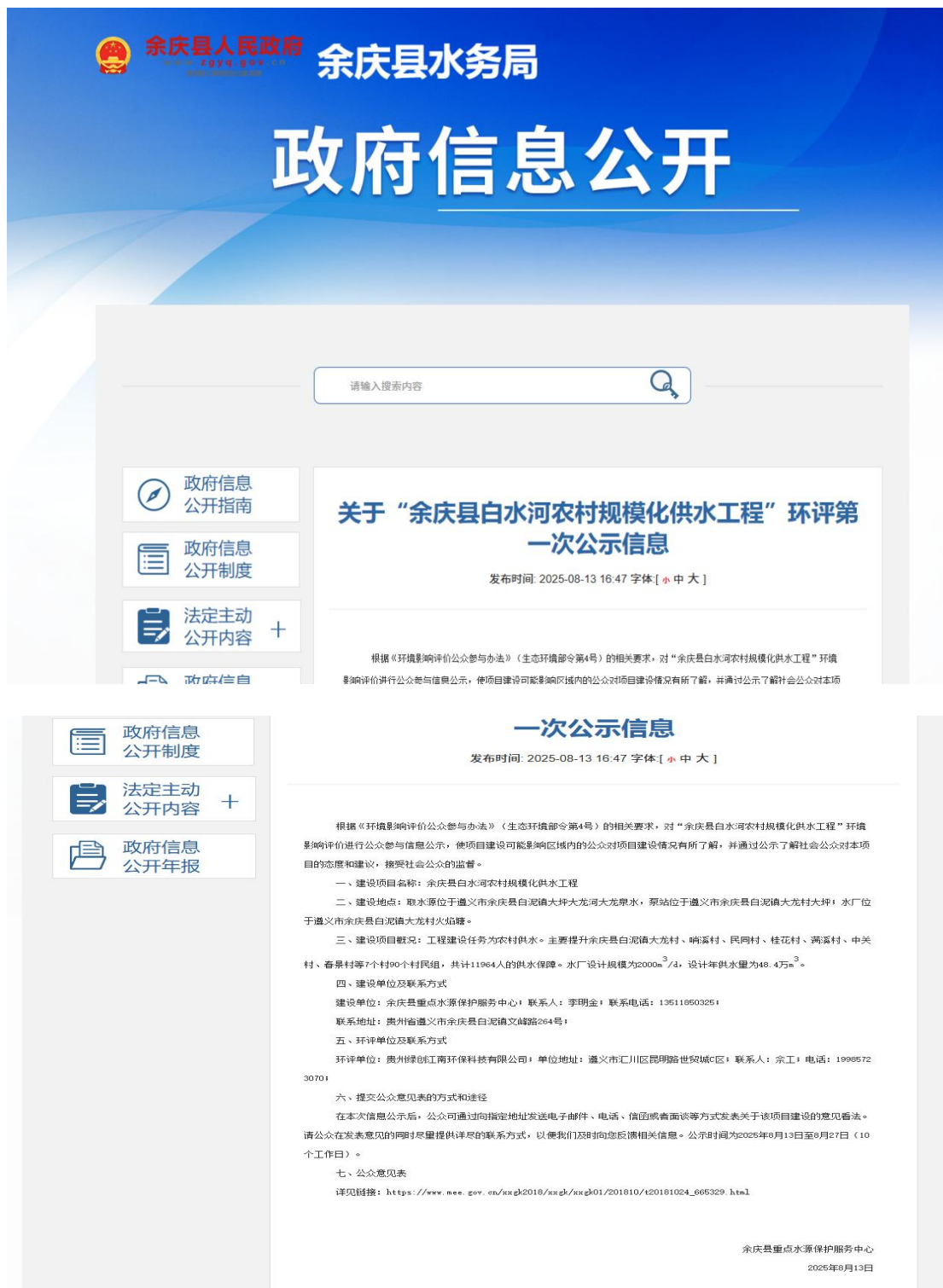
图 1 第一次公示截图