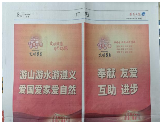
图 5 第一次报纸公示截图